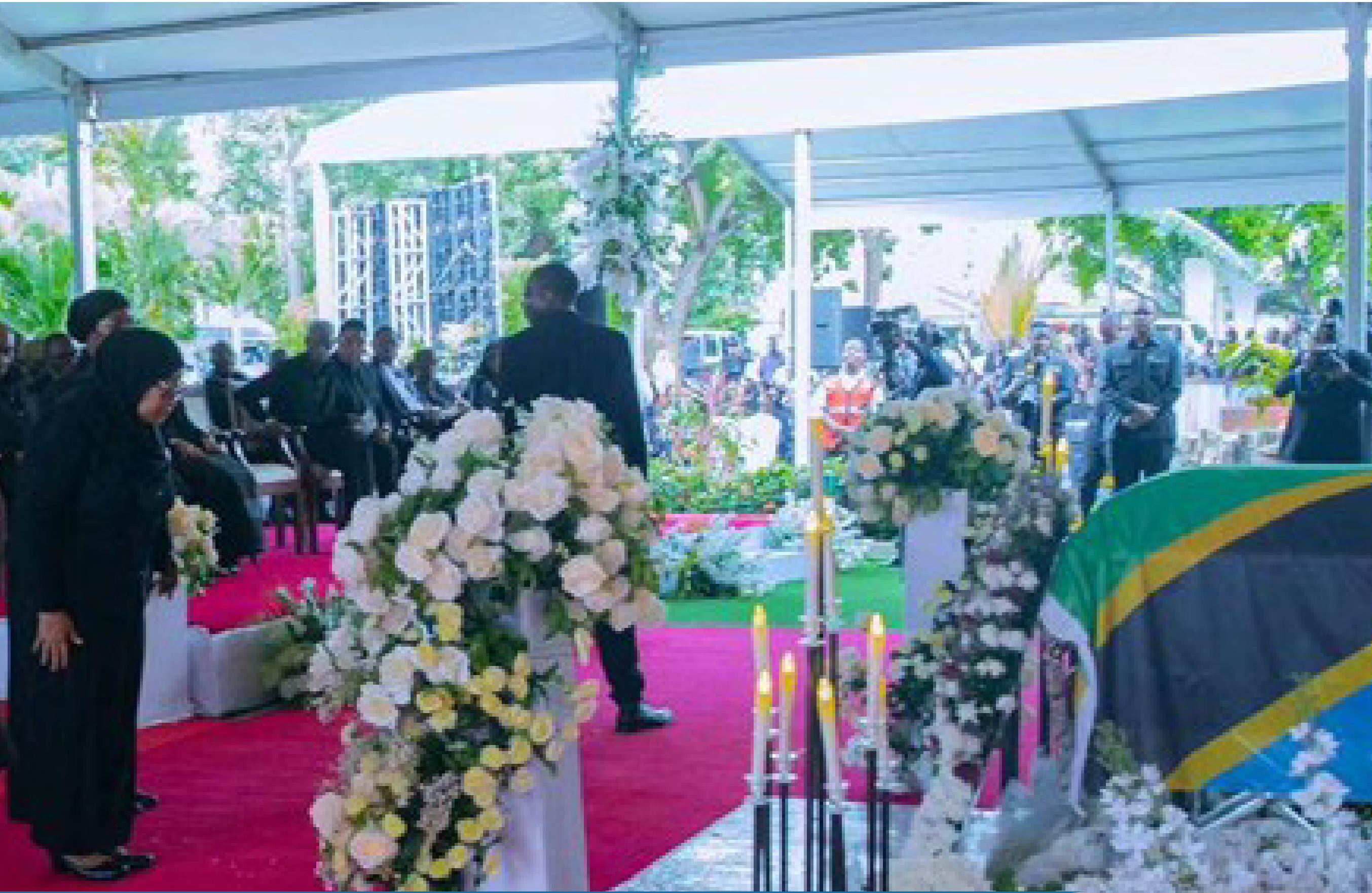
Rais wa Jamhuri ya Muungano wa Tanzania, Dkt. Samia Suluhu Hassan akitoa heshima za mwisho kwenye jeneza lenye mwili wa aliyekuwa Waziri wa Nchi, Ofisi ya Waziri Mkuu (Sera, Uratibu na wenye Ulemavu), Marehemu William Vangimembe Lukuvi, katika viwanja vya Karimjee jijini Dar es Salaam tarehe 28 Machi, 2026.