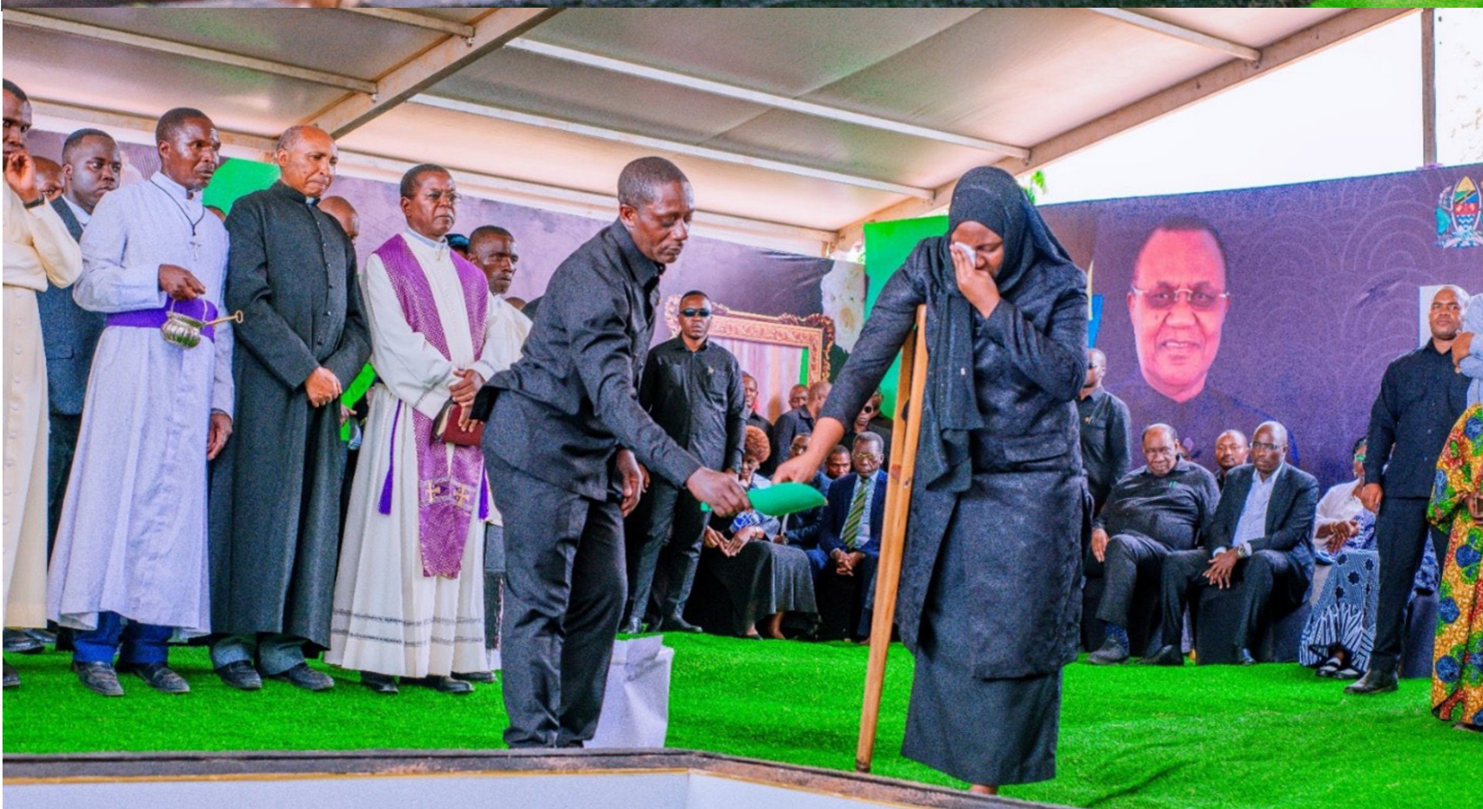
Naibu Waziri Ofisi ya Waziri Mkuu (Sera, Bunge, Uratibu na Wenye Ulemavu) Mhe. Ummy Nderiananga, akiweka Mchanga kwenye Kaburi la aliyekuwa Waziri wa Nchi Ofisi ya Waziri Mkuu Sera Bunge Uratibu na Wenye Ulemavu.