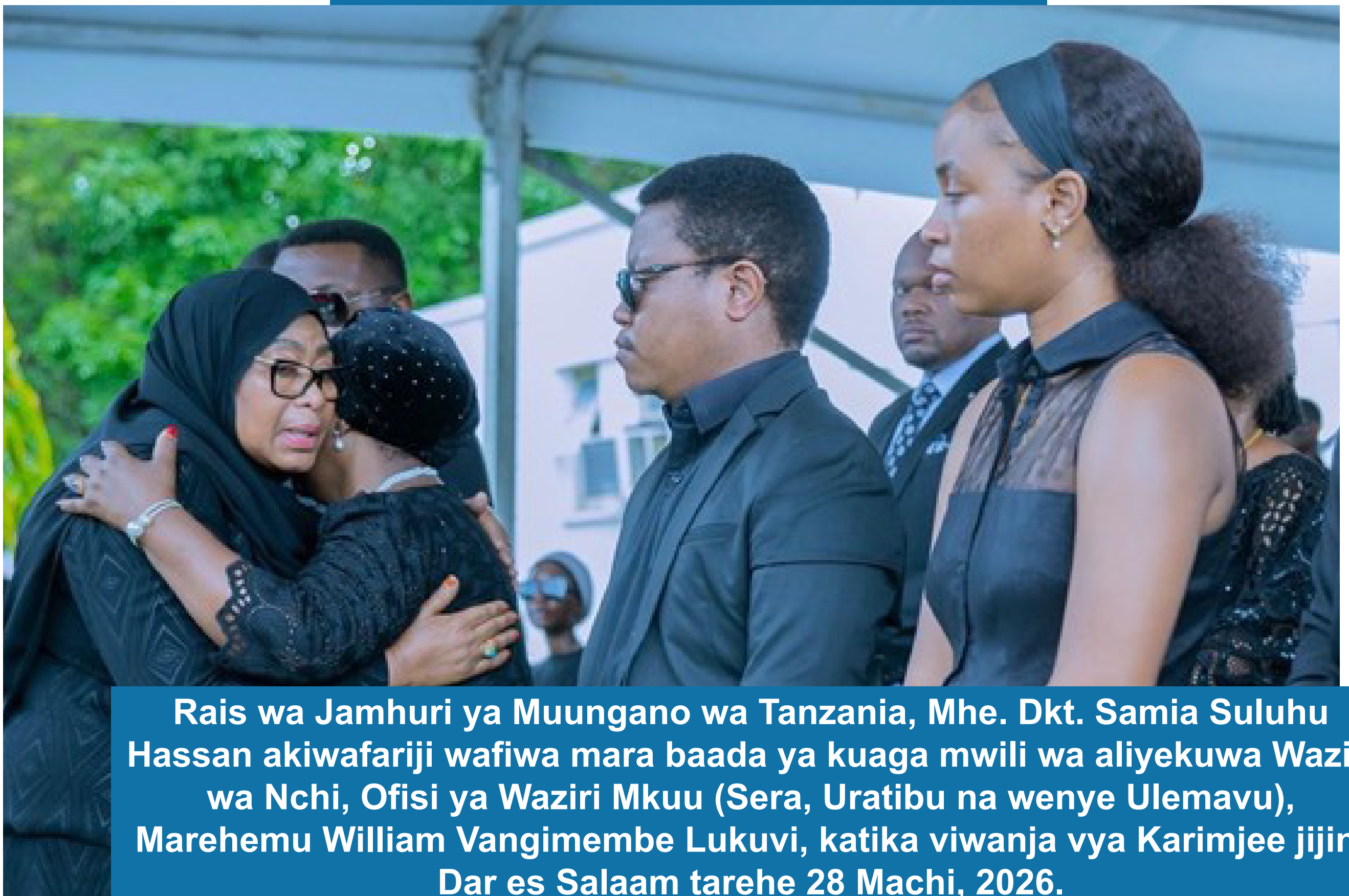
Rais wa Jamhuri ya Muungano wa Tanzania, Mhe. Dkt. Samia Suluhu Hassan akiwafariji wafiwa mara baada ya kuaga mwili wa aliyekuwa Waziri wa Nchi, Ofisi ya Waziri Mkuu (Sera, Uratibu na wenye Ulemavu), Marehemu William Vangimembe Lukuvi, katika viwanja vya Karimjee jijini Dar es Salaam tarehe 28 Machi, 2026.